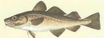
Morue cabillaud ( Gadus morhua ) 42 cm