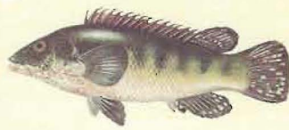
Vieille ( Labrus bergylla )