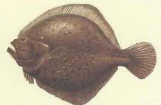
Turbot ( Psetta maxima ) 30 cm