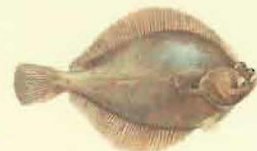
Plie carrelet ( Pleuronectes platessa ) 27 cm