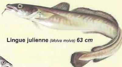
Lingue julienne ( Molva molva ) 63 cm