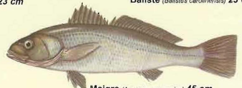
Maigre ( Argyrosomus regius ) 45 cm