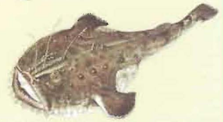
Baudroie lotte ( Lophius piscatorius ) 50 cm

Attention, certaines réglementations locales peuvent être différentes, se renseigner auprès des AFFAIRES MARITIMES du Quartier maritime concerné. * Tailles préconisées par la FNPPSF. Cette planche est valable pour le littoral Atlantique, la Manche et la Mer du Nord. Lorsque deux tailles sont indiquées, il est nécessaire de se renseigner auprès des autorités locales.