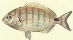
Sar ( Diplodus sargus ) 25 cm