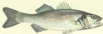
Bar ( Dicentrarchus labrax ) 42 cm