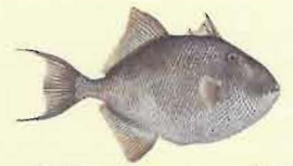
Baliste ( Balistes carolinensis ) 23 cm *