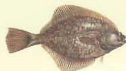
Flet ( Pleuronectes flesus ) 20 cm