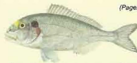
Dorade royale ( Sparus aurata ) 23 cm