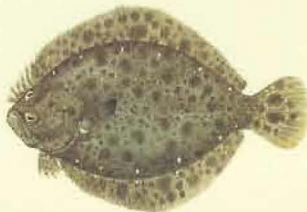
Barbue ( Scophthalmus rhombus ) 30 cm