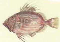
Saint Pierre ( Zeus faber ) 30 cm *