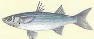
Mulet muge ( Mugil cephalus/Chelon labrosus ) 30 cm